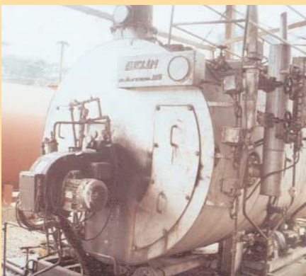
Chaudière à fuel pour la cuisson des noix à la SDAI

Environnement Recherche Action Face Agence Sonel Biyem-Assi, Yaoundé, CAMEROUN Tél. + 237 22 31 56 67 Email : era_cameroun@yahoo.fr