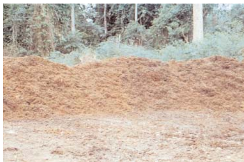
Stockage de fibres

De plus, la biométhanisation pourrait être une solution à considérer pour les effluents liquides des palmeraies. Le potentiel est énorme mais le cadre réglementaire reste très peu favorable au Cameroun pour le moment.