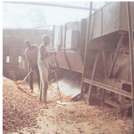
Noix de palme à la SDAI

- une diminution des coûts d'évacuation des produits connexes autour de l'unité de transformation.