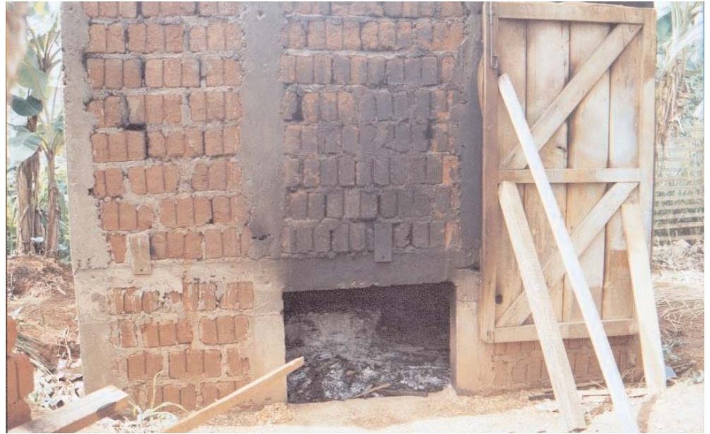
Vue d'ensemble du séchoir à bois

Ce séchoir a été monté de façon artisanale avec une main d'œuvre locale. Le coût d'installation d'un tel séchoir à bois peut être estimé entre 600 000 FCFA et 1 000 000 FCFA (1 000 à 1 500 euros). La main d'œuvre nécessite une personne pour charger le bois (6 fois par jour) et surtout pour enlever les cendres.