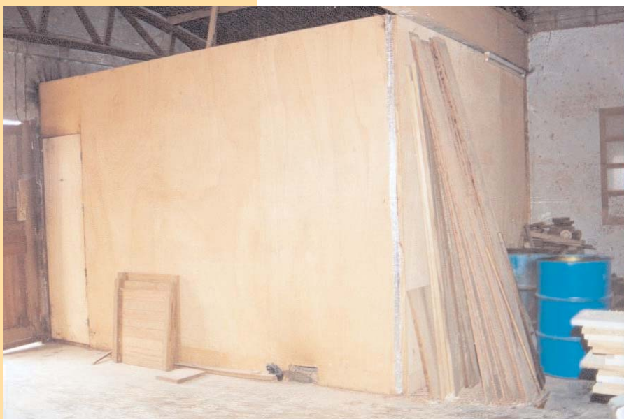
Chambre de séchage du GIC PROMEB

Augmentation des revenus des menuisiers grâce au séchage du bois utilisant les copeaux et la sciure comme source de chaleur