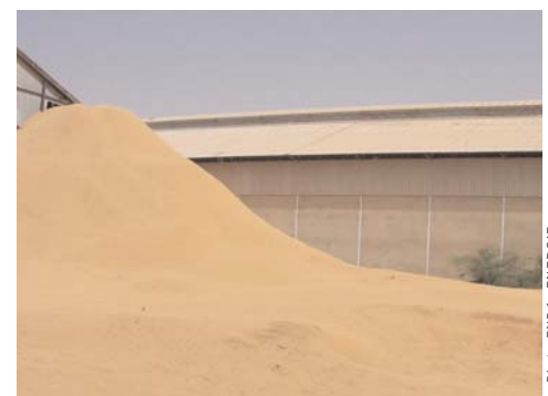
Balles de riz stockées derrière une rizerie industrielle

La vapeur est détendue dans une turbine à condensation qui est couplée à un alternateur. Une partie de la vapeur et/ou des gaz de combustion peuvent être dirigés vers un échangeur de chaleur pour produire de la chaleur nécessaire au séchage du riz de contre-saison.