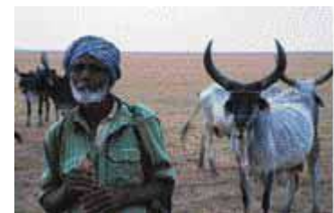
"Pastoralist in India."

conservation sont des approches ex situ, par exemple la congélation des semences ou dans des exploitations agricoles gérées par les gouvernements. Les gardiens de troupeaux sont tout aussi concernés, et rarement conscients des droits qu'ils ont sous la CDB-NU et d'autres cadres légaux internationaux et nationaux.