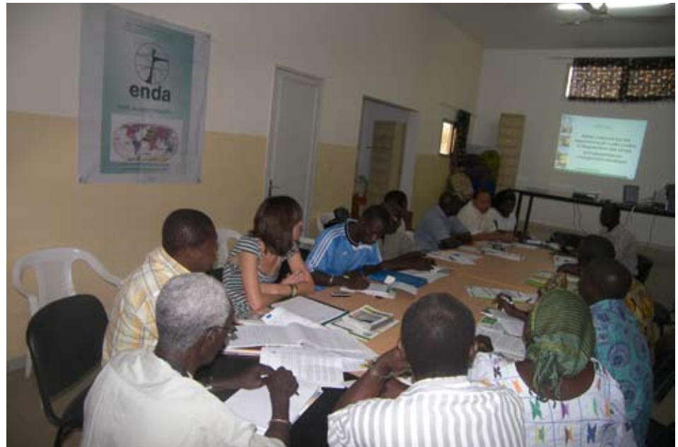
Atelier de Ziguinchor

ENDA poursuit, à travers l'atelier national sur