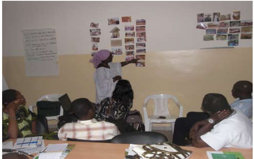
Participants durant l'atelier de Ziguinchor

La région n'en est pas moins confrontée aux problèmes environnementaux dont la déforestation, la dégradation de ses sols du fait, entre autres, de la salinisation, des techniques d'aménagements hydro agricoles pas toujours