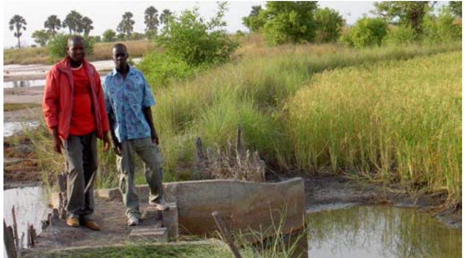
Rizières de Ziguinchor

Avant la mise en œuvre du projet, chaque village a mis en place un comité de gestion des aménagements de 5 membres chargé, en relation avec les techniciens d'Enda-Acas, de conduire les opérations d'endiguement. Ensuite, il a été procédé à la définition et à la répartition des tâches entre partenaires. Ainsi, Enda-Acas a été chargé de la recherche de financement, de la définition des normes de construction des digues et des ouvrages, de la formation des membres du comité de gestion