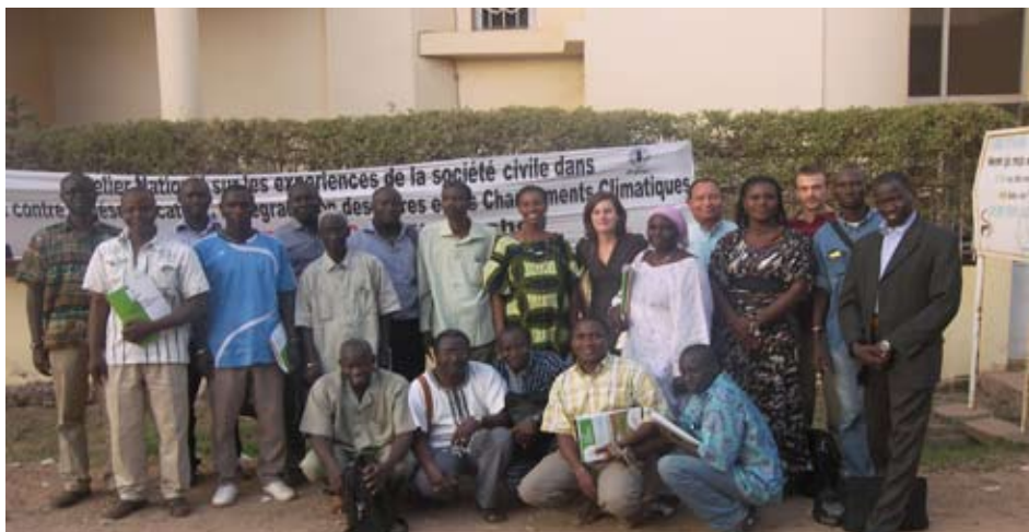
Photo de famille - atelier de Ziguinchor

RECOMMANDATIONS DU PANEL Des recommandations fortes ont sanctionné le panel. Il s'agit, entre autres, de : la promotion des Conventions locales 1 au niveau des terroirs ; la promotion de l'aménagement des forêts ; l'identification d'opportunités de financement (sponsoring) d'émissions radiophoniques pour la sensibilisation des populations ; l'engagement et la responsabilisation de la presse et des Elus, notamment, en matière de déforestation et de lutte contre les feux de brousse ; convier les médias et les Elus à voir ce qui se fait sur le terrain la promotion des alternatives innovantes et adaptées aux réalités locales de l'élargissement de la base de données des acteurs concernés par ces questions climatiques et environnementales.