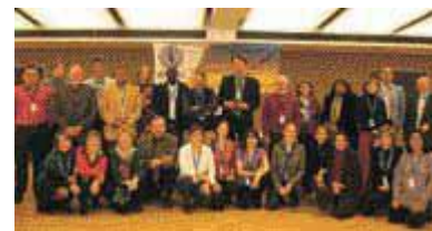
"L'équipe Drynet et certains de ses partenaires stratégiques pendant la troisième rencontre annuelle en novembre 2009, Rome, Italie"

et à avoir une idée claire de ce qui devrait suivre, Drynet a organisé sa Troisième réunion annuelle au début du mois de novembre en Italie. La réunion se divisait en deux parties : une réunion interne pour élaborer une stratégie sur la suite à donner et une réunion externe de deux jours à laquelle nous avons convié les principales parties prenantes engagées dans les questions des terres arides et d'éventuels partenaires stratégiques pour une future coopération. Cette réunion s'est tenue dans le bâtiment du FIDA et certains de leurs employés ont pu nous rejoindre, nous apportant des informations capitales. D'autres discussions fondamentales ont pu être menées grâce à la présence de certains autres collègues du Mécanisme global, de la FAO, de la Commission européenne, des représentants de la Suisse et de la France, de l'ILC (International Land Coalition) et de DesertNet. Drynet a présenté le travail de ces dernières années et a énoncé les trois champs d'actions principaux que le