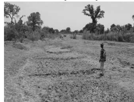
Marigot asséché à Zanguéna, Mali