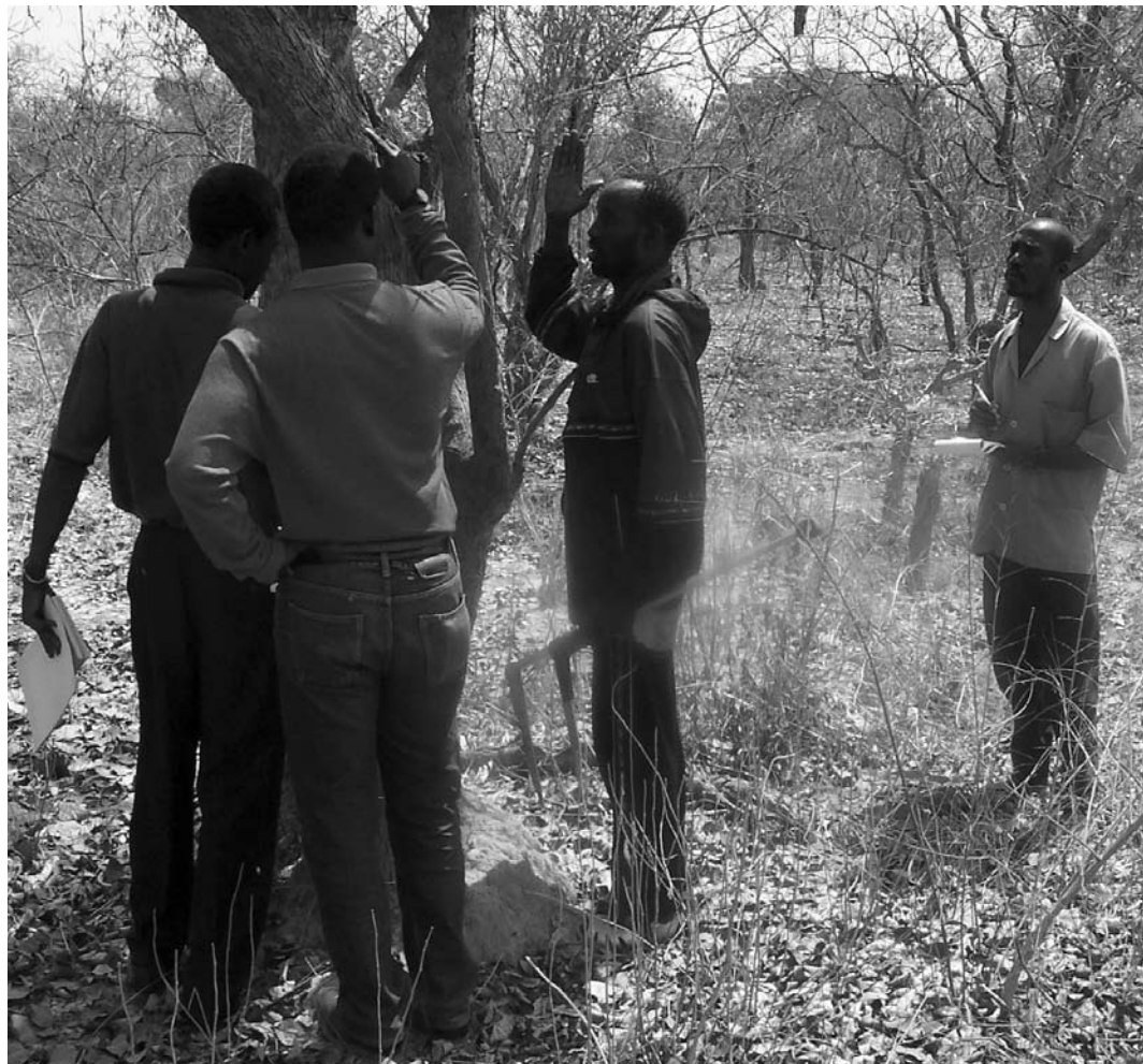
Mesure du diamètre des arbres par des paysans maliens