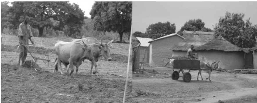
Bœufs de labour et charette de transport de la fumure à Ginsou, région de Sikasso