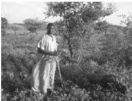
Exploitation familiale à Thiowor, Sénégal