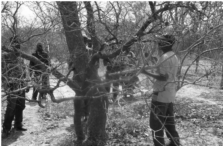
Paysans prélevant des données, Mali

Comme on le sait, la dégradation est causée dans une grande mesure par les activités des populations rurales. Par conséquent, une manière réaliste et économique de contrecarrer ces activités c'est d'impliquer ces populations dans une utilisation durable de la forêt. En fait, il y a beaucoup d'exemples de gestion durable des forêts par les populations locales en Afrique et dans le reste du monde, dans le