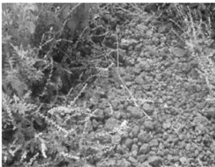
Cordon pierreux, Santhié Sérères, Sénégal