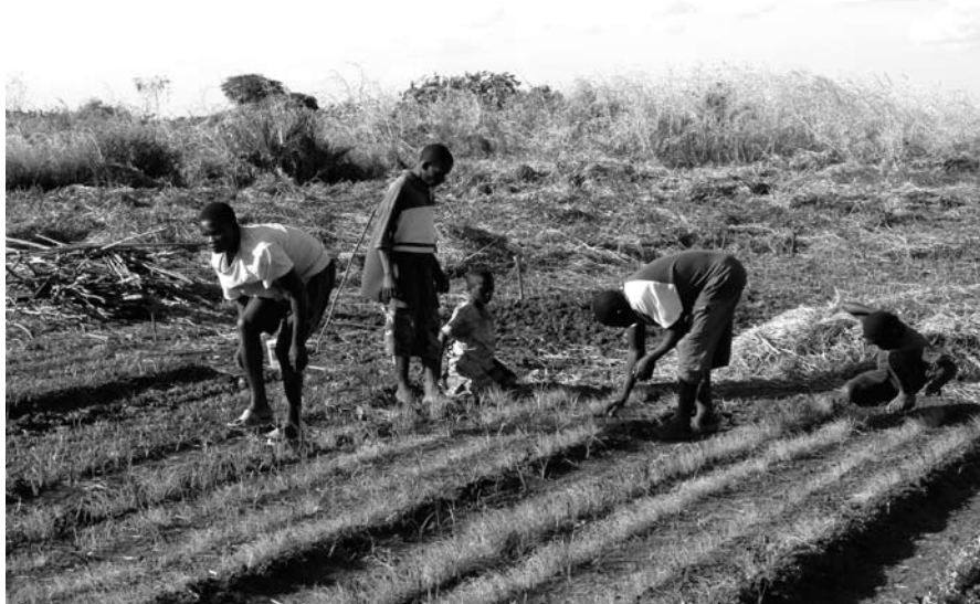
Travaux champêtres à Mutarara, Vallée du Zambèze