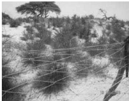
Fixation de dune à Diourmel, Sénégal

Le champ est clôturé, dans ce cas avec le prosopis et Euphobia balsamifera qui servent de brise-vent. Des épineux sont utilisés pour servir de protection externe. Le prosopis résiste à la sécheresse, sert de bois de chauffe et peut être utilisé dans la construction des maisons. Toutes ces conditions favorisent la régénération et l'apparition de nouvelles espèces. Les bénéficiaires directs de cette exploitation familiale sont 4 ménages de 10 personnes chacun. La cohésion sociale est ainsi importante pour une pérennisation des stratégies mises en place. Le prix d'un tel aménagement pour 1 ha est estimé entre 275 000 et 1 314 000 F CFA selon le type de clôture.