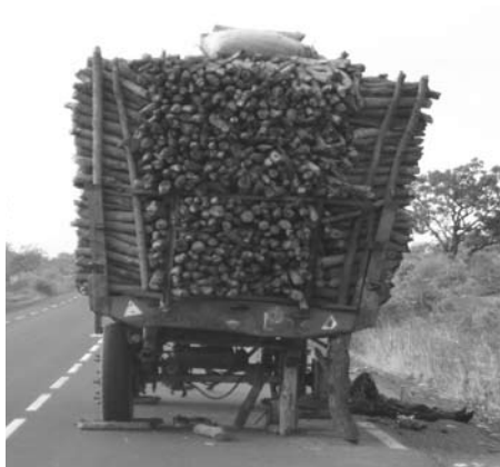
Commercialisation de bois de chauffe sur la route de Bougouni, au sud du Mali