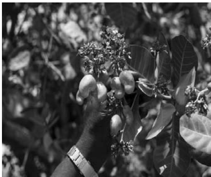
Cajou, sur l'île de Bubaque, Guinée Bissau