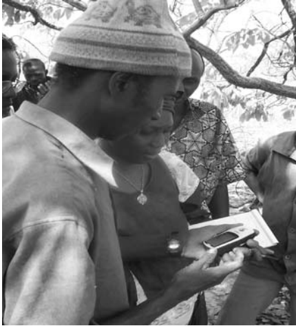
Paysans maliens se servant du GPS, Mali